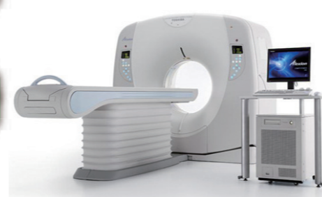
マルチスライスCTシステムAlexion™