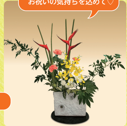
開院記念日★ お祝いの気持ちを込めて♡