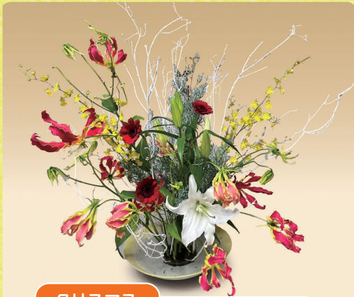
クリスマス クリスマスカラーの赤と緑を主に華やかさをイメージしました。

一人でも多くの方にご覧頂き、癒しや心安らぐ空間をお届けできるよう一同取り組んでまいります。